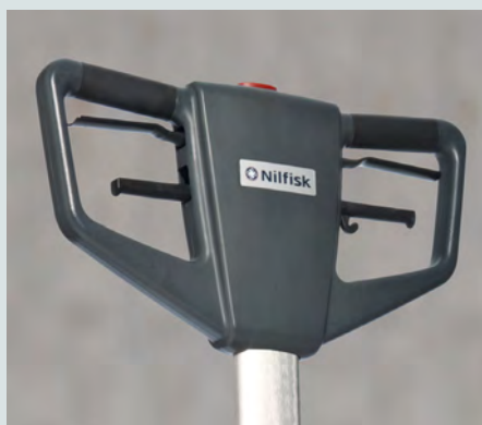
Ergonomisk greb med glatte runde kanter for øget komfort, nemmere betjening og mindre belastning.