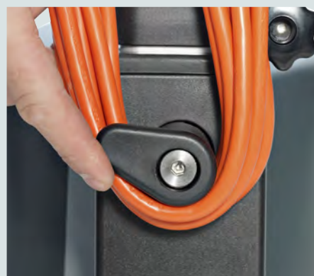
Kabelkrog så kablet kan ophænges pænt på maskinen.